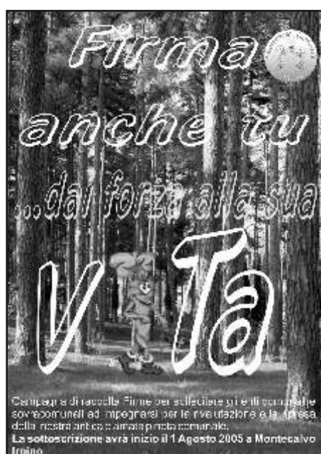
Compilate e di raccolta firme per sollecitare gli e gli comunali e sovcomuni ad impegnarsi per le rivestiture e la ripresa della ricerca antica e antica pratica comunale. La sottoscrizione avrà inizio il 1 Agosto 2005 a Montecalvo Irpino

C'era una volta un ameno villaggio dell'entroterra di una felice e fertile regione del Sud. A capo della comunità vi era un Gran Consiglio, democraticamente eletto, a cui era stato demandato il compito di decidere, con saggezza e lungimiranza, le sorti di una piccola società che, fiduciosamente, si era affidata alla guida dei saggi del villaggio. Lunghe e dispendiose erano state le consultazioni del popolo, dibattute e combattute con il modesto fronte opposto, presentatosi in alternativa, sconfitto, ma difeso con onore. L'assemblea costituitasi era presieduta da un giovane saggio. ( L'ossimoro, in questo caso, stride con la realtà, non per definizione, ma per contezza della poca credibilità del secondo termine, difficilmente riferibile al soggetto. Comunque la tradizione tramanda e indica come saggi chi veniva posto a governo di una società, e il nostro affabulatore non può sfuggire alle intramontabili regole lessicali.)